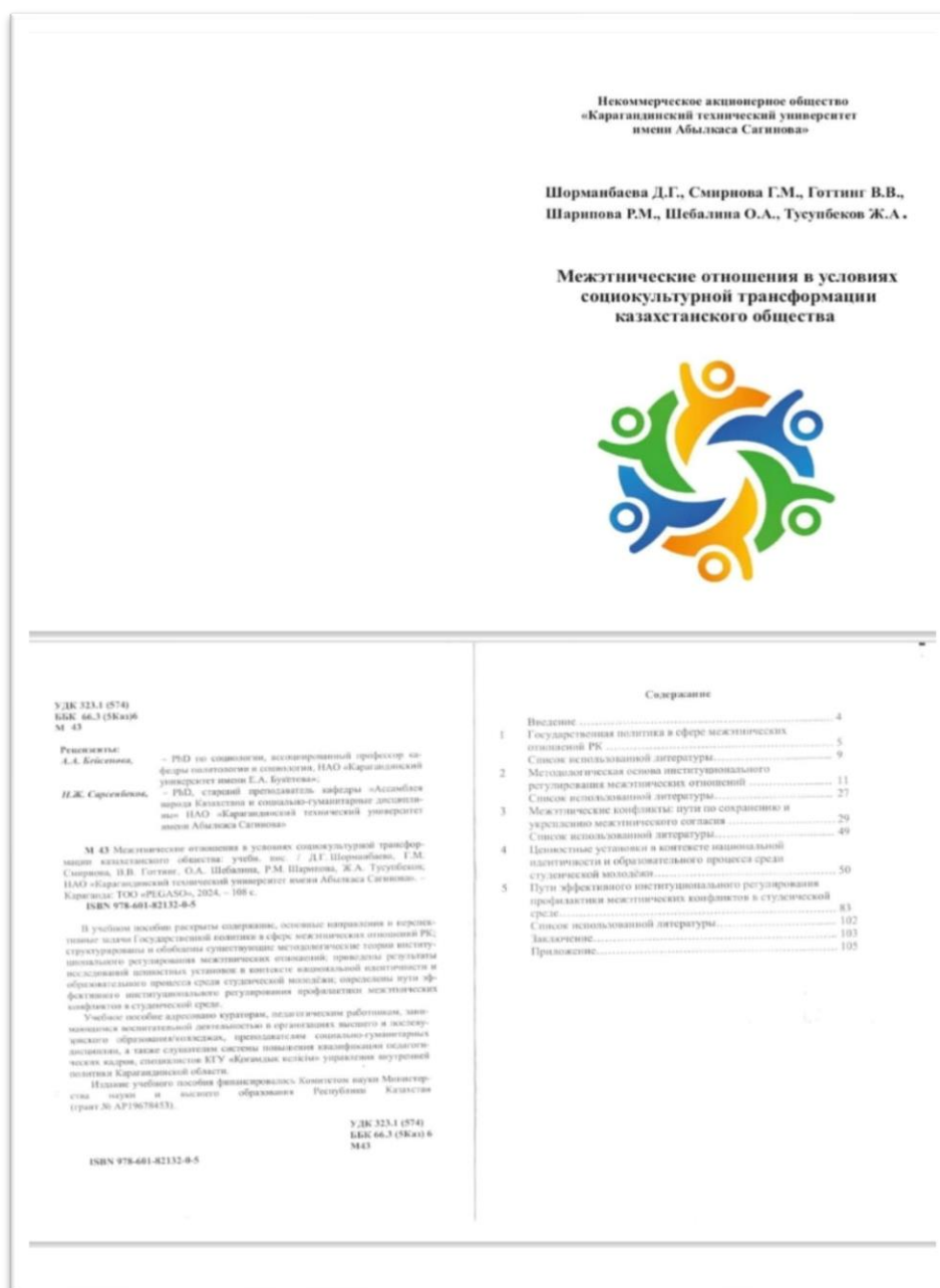
Рисунок 3 – Учебное пособие «Межэтнические отношения в условиях социокультурной трансформации казахстанского общества»

4.Разработано техническое задание по созданию цифровой платформы «Кросскультурный диалог».