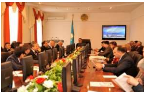
Корпоративтік Университет құру жөнінде ҚарТУ-да өткен дөңгелек үстел отырысы

Елдің үдемелі индустриялық-инновациялық дамуы оған жоғары оқу орындарының қатысуының жаңа жүйесін қалыптастыру қажеттігін айқындайды. Осы бағытта сенімді алға баса отырып, ҚарТУ заманауи инновациялық-зерттеу университеті ретінде дамуда. Қарағанды техникалық университеті қызметінің жоғары нәтижесіне ҚарТУ базасында Қазақстандағы алғашқы болып 2008 жылы құрылған Корпоративтік Университет (КУ) есебінен айтарлықтай дәрежеде қол жеткізілді. Корпоративтік университеттің артықшылықтары оның қатысушыларының құрамын едәуір арттыруға мүмкіндік берді: 2008 жылы 22 – ден, 2015 жылы 86-ға дейін. Беларусь ұлттық техникалық университеті, «Минск трактор зауыты» ӨБ, «Белаз – «Белаз-холдинг» холдингінің Басқарушы компаниясы» ААҚ сияқты ірі ғылыми және өндірістік ұйымдар жаңадан қабылданды.