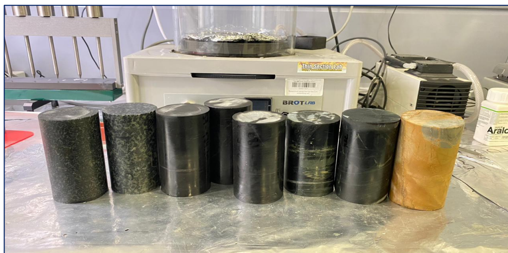
Рисунок 3 – Проведение исследований во время прохождения стажировки в г. Астана