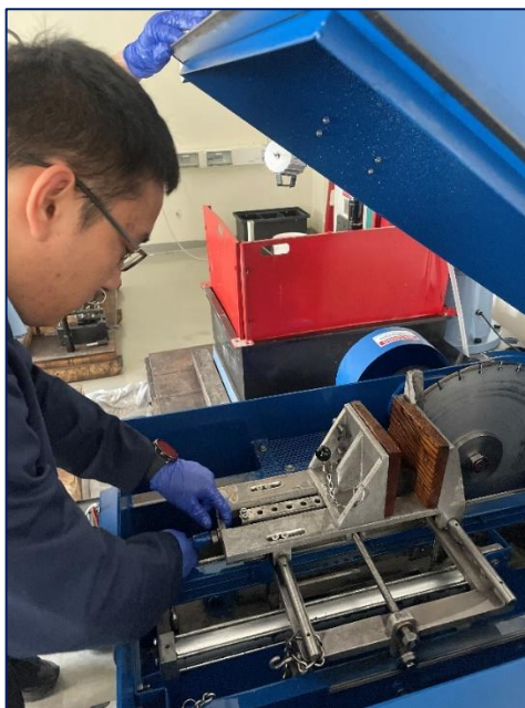
Рисунок 2 – Испытание образцов по керну