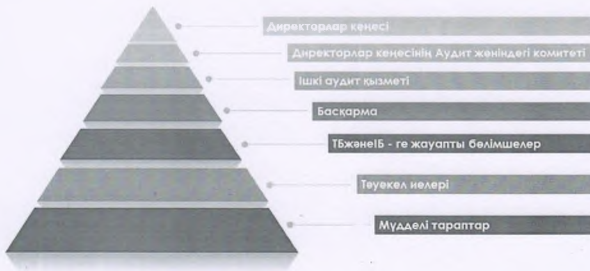
1-сурет. Тәуекелдерді басқару және ішкі бақылау жүйесінің құрылымы

12. Қоғамның ТБЖІБЖ құрылымы қоғамның келесі органдары мен бөлімшелерін тарта отырып, бірнеше деңгейде ұсынылған (1-сурет).