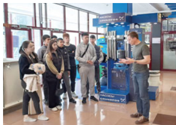
лер» кафедрасының студенттері (ТЭ-23-1 тобы) оқу практикасының жетекшілері

Жақында Әбілқас Сағынов атындағы ҚарТУ-дың «Энергетикалық жүйе-