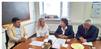
ной программы бакалавриата — Био-

Были рассмотрены вопросы сотрудничества, прохождения всех видов практик обучающимися образователь-