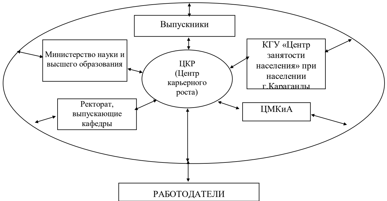
Рисунок 1 – Механизм содействия трудоустройству выпускников КарГУ

6.7 Проведение работы по увеличению числа работодателей, где прохождение производственных практик сопровождается последующим трудоустройством.